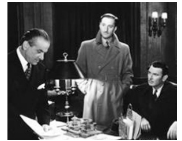
1941 INTERNATIONAL LADY de Tim Whelan avec George Brent