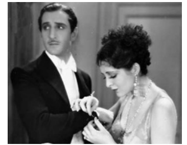
1930 A NOTORIOUS AFFAIR de Lloyd Bacon avec Billie Dove