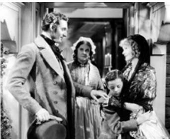
1935 DAVID COPPERFIELD (David Copperfield, the Younger) de G. Cukor avec F. Bartholomew