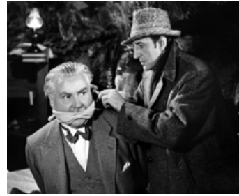
1945 LA MAISON DE LA PEUR (House of Fear) de Roy W. Neill avec Nigel Bruce