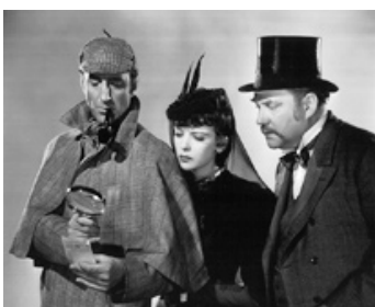
1939 LES AVENTURES DE SHERLOCK HOLMES (Sherlock Holmes) d'A. Werker avec I. Lupino