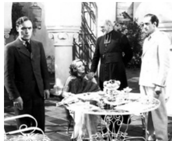
1936 LE JARDIN D'ALLAH (The Garden of Allah) de R. Boleslawski avec Ch. Boyer, M. Dietrich