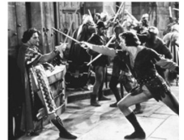
1938 ROBIN DES BOIS (The Adventures of Robin Hood) de Michael Curtiz avec Errol Flynn