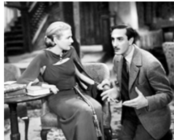
1937 LOVE FROM A STRANGER de Rowland V. Lee avec Ann Harding