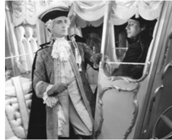
1935 LE MARQUIS DE SAINT-ÉVREMENT (Tales of two Cities) de J. Conway avec Donald Woods