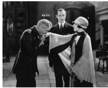
1929 LA FIN DE MADAME CHENEY (The Last of Mrs Cheney) de Sidney Franklin avec N. Shearer