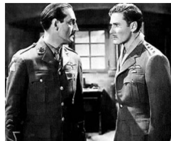
1938 LA PATROUILLE DE L'AUBE (The Dawn Patrol) d'E. Gouling avec Errol Flynn