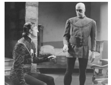
1939 LA TOUR DE LONDRES (Tower of London) de Rowland V. Lee avec Boris Karloff