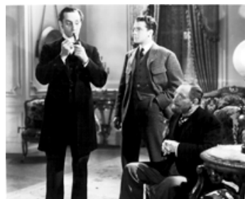
1939 LE CHIEN DES BASKERVILLE (The Hound of Baskerville) de S. Lanfield avec R. Greene, L. Atwill