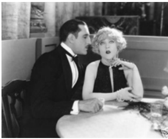
1925 L'ÉPOUSE MASQUÉE (The Masked Bride) de Christy Cabanne avec Mae Murray