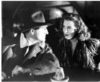
1942 LA VOIX DE LA TERREUR (Sh. Holmes and the Voice of Terror) de J. Rawlins avec Evelyn Anker