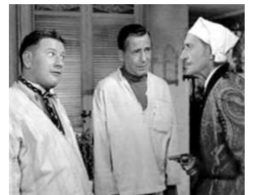
1955 LA CUISINE DES ANGES (We're no Angels) de M. Curtiz avec Humphrey Bogart, P. Ustinov