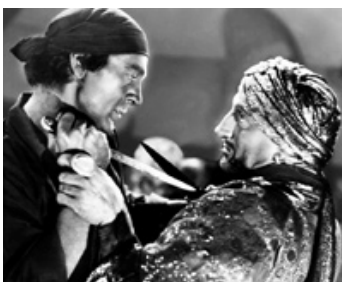
1938 LES AVENTURES DE MARCO-POLO (The Adv. of Marco Polo) d'A. Mayo avec G. Cooper