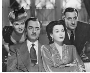
1942 CROSSROADS de Jack Conway avec William Powell, Hedy Lamarr, Claire Trevor