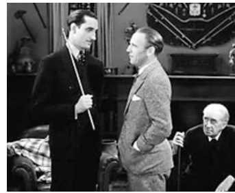
1930 THE BISHOP MURDER CASE de Nick Grinde avec Roland Young, A. Francis