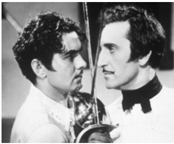
1940 LE SIGNE DE ZORRO (The Mark of Zorro) de Rouben Mamoulian avec Tyrone Power