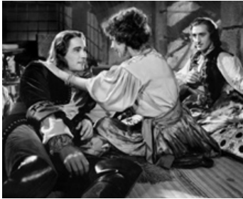
1935 CAPITAINE BLOOD (Captain Blood) de Michael Curtiz avec Errol Flynn