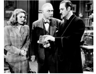
1945 LA FEMME EN VERT (The Woman in Green) de Roy W. Neill avec N. Bruce, Hilary Brooke