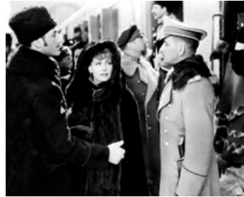
1935 ANNA KARÉLINE (Anna Karenina) de Clarence Brown avec Greta Garbo, Fr. March