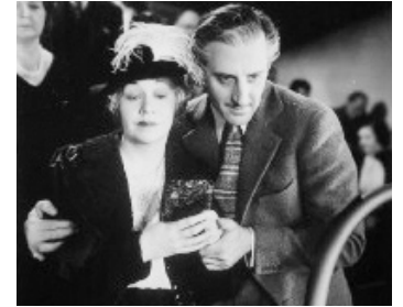
1935 UNE PLUME AU CHAPEAU (A Feather in her Hat) d'Alfred Santell avec Pauline Lord