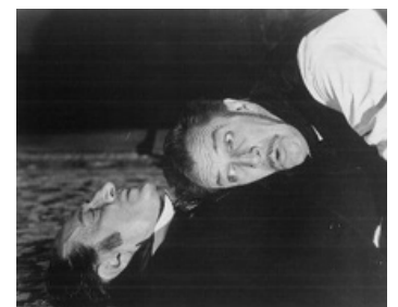
1963 THE COMEDY OF TERRORS de Jacques Tourneur avec Vincent Price