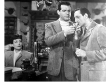
1943 UN ESPION A DISPARU (Above Suspicion) de R. Thorpe avec J. Crawford, F. MacMurray