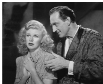
1946 HEARTBEAT de Sam Wood avec Ginger Rogers