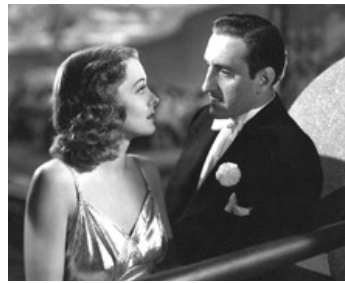
1941 THE MAD DOCTOR de Tim Whelan avec Ellen Drew