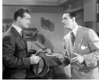
1944 LE BAL DES SIRÈNES (Bathing Beauty) de George Sidney avec Red Skelton