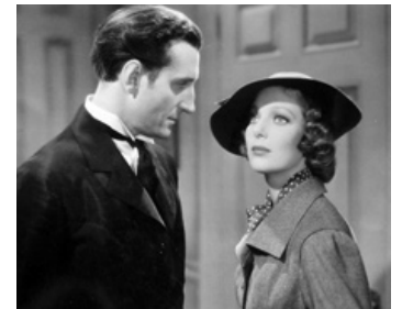
1936 PRIVATE NUMBER de Roy Del Ruth avec Loretta Young