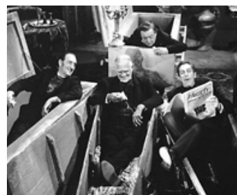
1962 L'EMPIRE DE LA TERREUR (Tales of Terror) de R. Coman avec V. Price, P. Lorre, B. Karloff