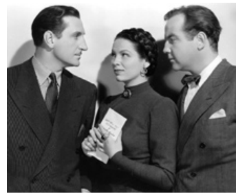
1941 LE CHAT NOIR (The Black Cat) d'Albert S. Rogell avec Br. Crawford, Gale Sondergaard