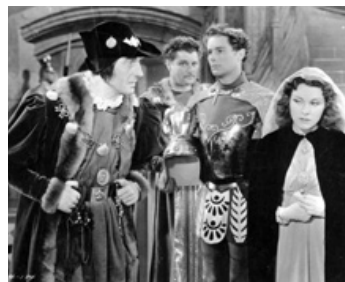
1938 LE ROI DES GUEUX (If I were King) de Frank Lloyd avec Frances Dee