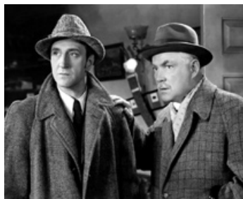
1946 SHERLOCK HOLMES ET LA CLEF (Dressed to kill) de Roy W. Neill avec Nigel Bruce