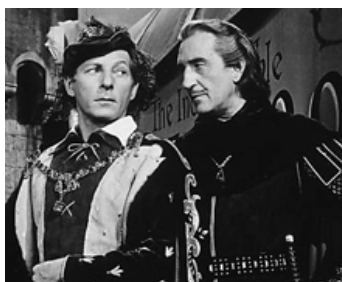
1955 LE BOUFFON DU ROI (The Court Jester) de Melvin Frank avec Danny Kaye