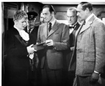
1946 LE TRAIN DE LA MORT (Terror by Night) de Roy W. Neill avec Mary Forbes, A. Mowbray