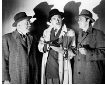
1944 LA FEMME AUX ARAIGNÉES (The Spider Woman) de R. W. Neill avec Dennis Hoey