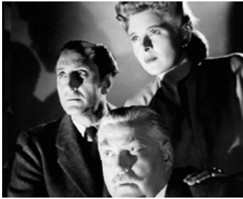
1944 LA PERLE DES BORGES (The Pearl of Death) de Roy W. Neill avec N. Bruce, Evelyn Ankers