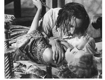
1944 L'AVENTURE VIENT DE LA MER (Frenchman's Creek) de Mitchell Leisen avec Joan Fontaine