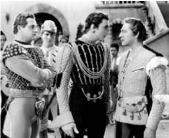
1936 ROMÉO ET JULIETTE (Romeo and Juliet) de George Cukor avec J. Barrymore, R. Denny