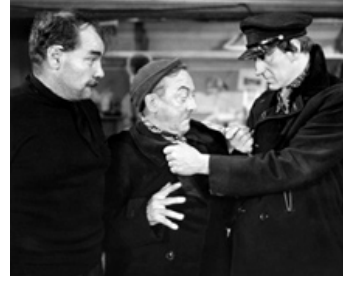
1943 L'ARME SECRÈTE (Sh. Holmes and the secret Weapon) de R. W. Neill avec Harry Cording