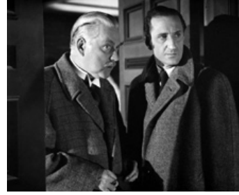
1944 LA GRIFFE SANGLANTE (The Scarlet Claw) de Roy W. Neill avec Nigel Bruce