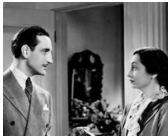
1935 KIND LADY de George B. Seitz avec Aline MacMahon