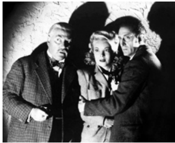
1943 ÉCHEC À LA MORT (Sh. Holmes faces Death) de R. W. Neill avec Nigel Bruce, Hilary Brooke